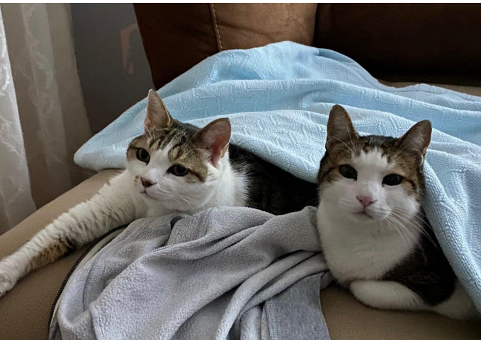
Resim 6: 13 yaşında iki dişi kedi