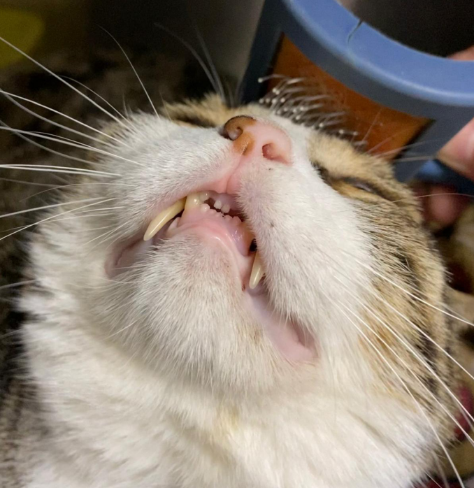
Resim 3: 10 yaşındaki kedinin taranması ve diş kontrolü

Ağız kokusu (kötü nefes), salya akıtma, yemek yerken zorlanma bizlere ağız ve diş sağlığı hakkında belirtiler vermektedir. Yaşlı kedimizin düzenli diş kontrollerini yaptırmak, diş eti kızarıklıklarını kontrol altında tutmak bu nedenle önemlidir. Bu bize düzenli beslenme için sinyal verir.