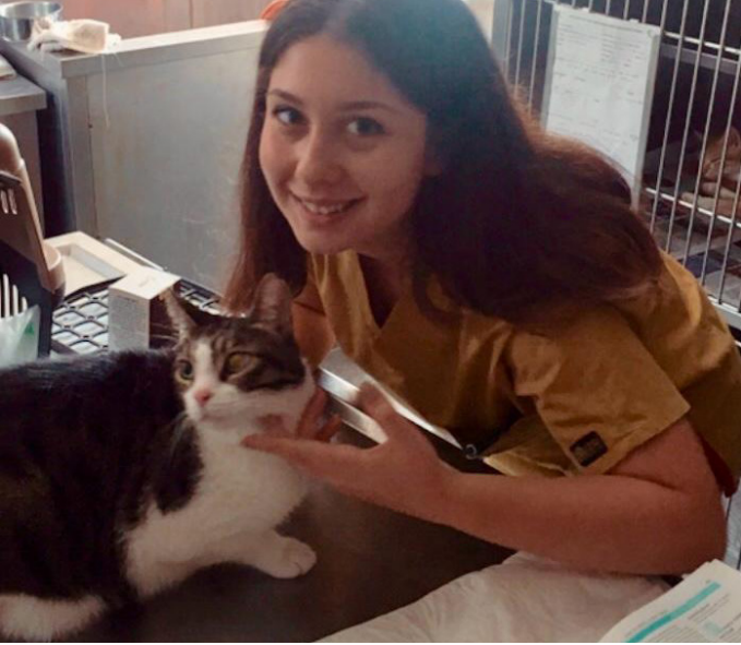
Resim 5: Rutin kontrollere gelen 7 yaşında erkek kedi

Veteriner hekimler tarafından önerilen ilaçlar ve takviyeler yaşlı kediler için düzenli olarak kullanılmalıdır. Herhangi bir yan etki ile karşılaşıldığında veteriner hekime mutlaka danışılmalıdır.