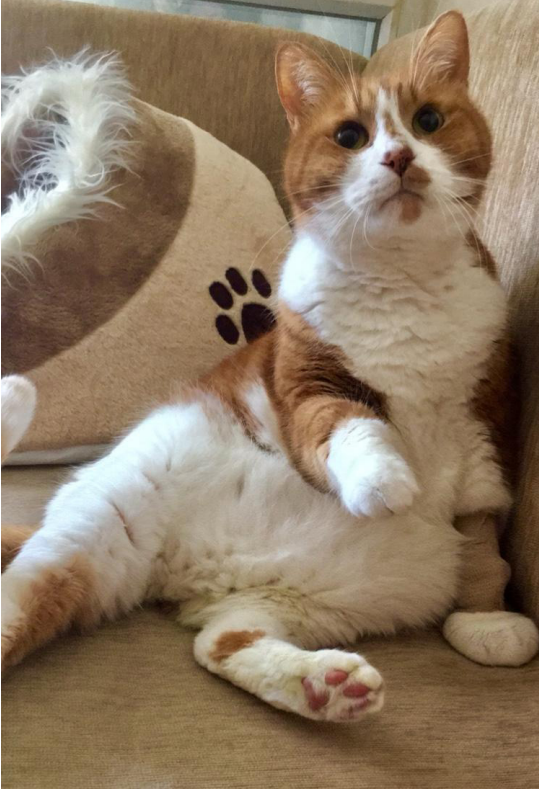
Resim 1: 14 yaşında sarı erkek kedi.

İyi bir beslenme, daha iyi veterinerlik hizmetleri ve evde iyi bakım ile kediler 20 yıl öncesine göre çok daha uzun yaşıyorlar. Son yıllarda kedilerin yaşı ve yaşam evreleri yeniden tanımlandı: Yaşı 11-14 arasında olan kediler, yaşlı olarak tanımlanırken 15 yaş ve üzerinde olanlar süper yaşlı kedi olarak tanımlanmaktadır.