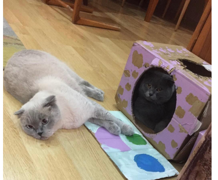
Resim 4: Biri 8, diğeri 7 yaşında olan iki kardeş kedinin oyun saati

Kedinizin favori oyuncağı var ise kedinizi oynatmaya çalışmak, hareket etmeye teşvik etmek açısından gayet yeterlidir. Uzun oyuncaklar, kedinizin bir tarafına yatıp ön patilerini kullanarak oyuncağı almasına ve arka patileri ile tekmelemesine olanak sağlayabilir. Bu hareket, birçok kedinin sevdiği ve gergin arka bacaklar için oldukça iyi bir egzersizdir.