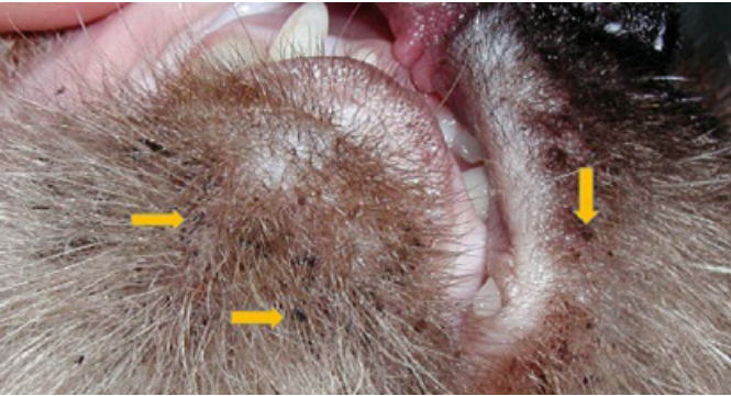
Resim 1. Çene aknesi olan kedi (Sheila Torres, Minnesota University, Small Animal Dermatology for Technician and Nurses)

Kedi aknesi, kedilerin çene ve ağız çevresinde siyah noktalar veya sivilce benzeri lezyonlar olarak ortaya çıkan bir deri hastalığıdır. Bu durum, kedilerin çene bölgesindeki yağ bezlerinin fazla sebum üretmesi sonucu oluşur. Çeşitli nedenler etken olabilir. Bazı nedenler arasında stres, hijyen eksikliği, plastik mama ve su kaplarının kullanımı, hormonal dengesizlikler ve bağışıklık sistemi zayıflığı yer alır.