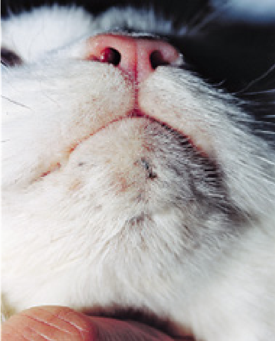
Resim 4. Bölge temizliği sonrası topikal mupirosin merhem ile tedavi sonrası görüntü (Hnilica ve Patterson, 2017 ss: 383).